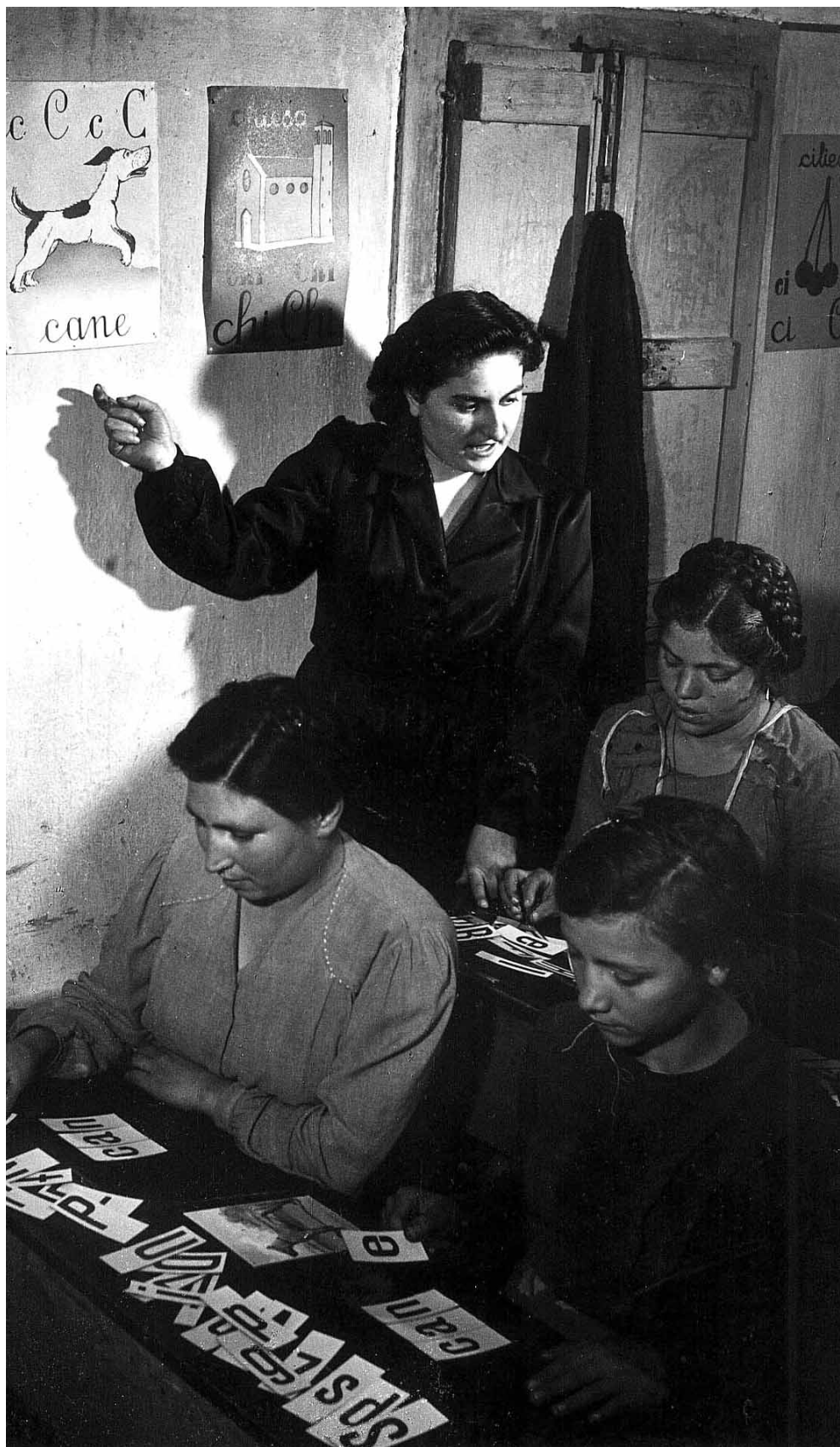
Interno di una scuola per la lotta all'analfabetismo, a. 1952